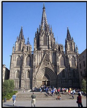
La cathédrale Sainte Eulalie