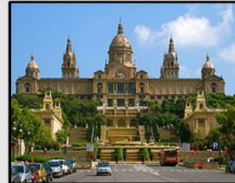
Musée national d'art de Catalogne

D'autres photos sont proposées sur le site Wikipédia